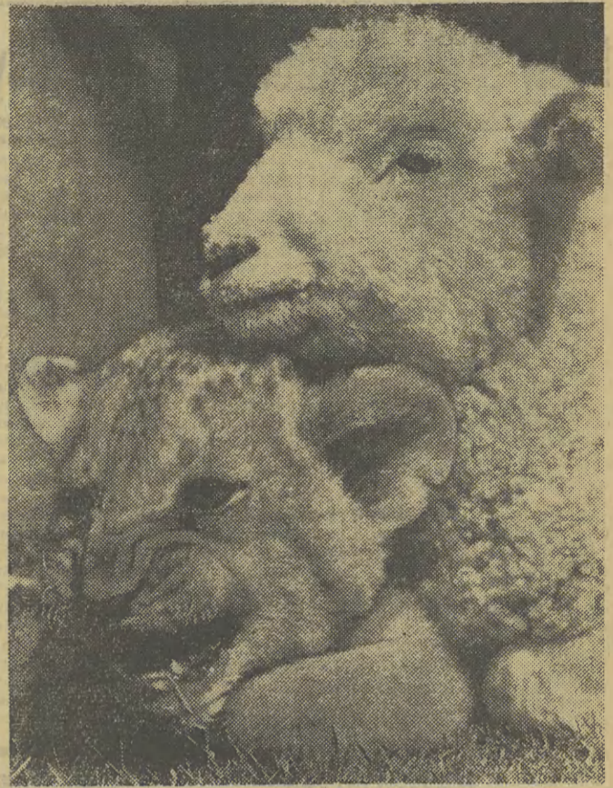
Małe, 6-tygodniowe lwiątko, nazwane Alistair i 2-miesięczny baranek Larry są jeszcze zbyt młodzi, by wiedzieć, że w przyszłości będą śmiertelnymi urogami. Łagodny Larry jak przystało na baranka, opiekuje się serdecznie małym, młodszym od niego lwiątkiem, które już szczerzy pierusze, wcale groźne „ząbki”. (bk)