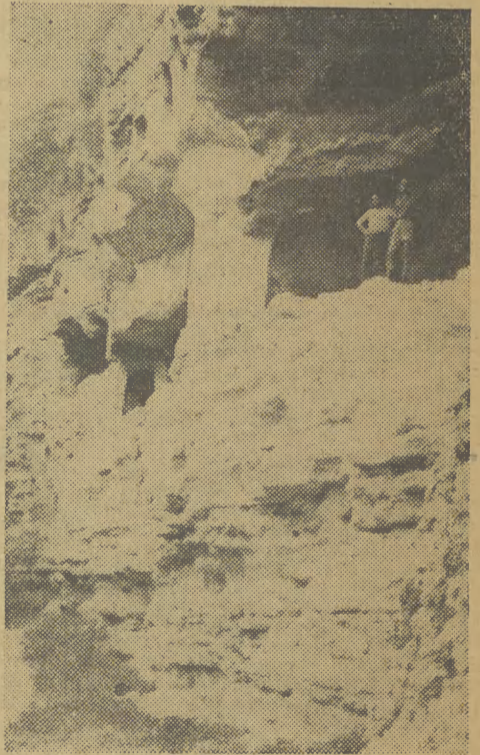
Zwiedzanie tego dawnego klasztoru nie jest nawet zbyt bezpieczne...