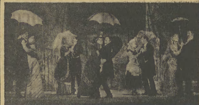
W Teatrze Rozmaitości w wieczór sylwestrowy grana będzie wesoła komedia M. Batuckiego - „Klub kawalerów”. Teksty piosenek napisał Witold Zechenter; przedstawienie re-

pochodzących ze wsi, należących do dzielnicy Nowa Huta. (1)