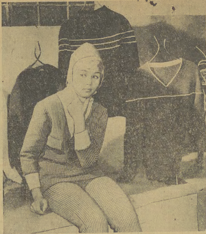
Człowym zadaniem przemysłu lekkiego w nowej pięcioletce będzie — obok dalszego zwiększenia ilości — podniesienie jakości produkcji, dostosowanie jej do rosnących potrzeb rynku i wymagań konsumenta. Zakłady Przemysłu Dzierżawskiego „Olimpia” w Łodzi nastawione są na produkcję dzianiny i trykotaży. Specjalność Zakładów, to jersey'owe sukienki, swetry, bluzeczki damskie, komplety narciarskie. Co miesiąc zakład wypuszcza około 20 nowych wzorów. Na zdjęciu: Nowe wzory w modelarni Zakładów.

W przeciwnym wypadku będzie chyba trzeba apelować do samego ministra Lesza... (eo)