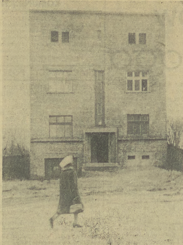
Oto nasz „bohater”. Budynek przy ul. Pasterskiej 6, który w całości przewedruje trasę 40 metrów.

Tyle o jednej z czekających nas rewelacji 1961 roku — pozostaje nam obecnie czekać cierpliwie aż zamierzenie to stanie się faktem, przechodząc do historii polskiego budownictwa jako pierwsza impreza tego typu w naszym kraju. (D. Paw.)