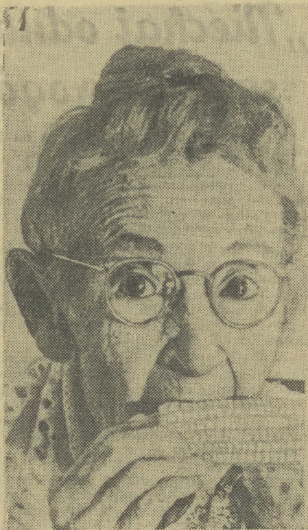
Babcia Moses — najslawniejsza malarzka Ameryki, cieszy się mimo 100 lat wspaniałym zdrowiem. Swej fortuny wcale nie ceni i uważa, że jej obrazy sprzedawane są za 500 dolarów i że „to wielki grzech płacić za obraz więcej niż 10 dolarów bez względu na to, kto jest jego autorem”. Niemniej najslawniejsze muzea świata liczą ją w cennach, chcąc zdobyć do swych zbiorów obrazki babci Moses.