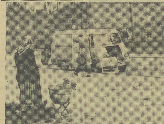
I kosz na śmieci może stać się „fotelem”. Tylko gdzie wtedy wyrzucać papiery, bilety tramwajowe, niedopałki itd. A poza tym takie użytkowanie kosza może się skończyć jego zniszczeniem.

8 godzin rozważyć i zapakować 30 ton cukru. Maszyna ta zostanie zainstalowana w magazynach WPHS przy ul. Grzegorzeckiej. Ponieważ jest bardzo ciężka (waży ok. 6,5 tony), przeto w pomieszczeniach tych przeprowadza się obecnie wzmacnianie stropów. Z końcem stycznia lub z początkiem lutego automat do „produkcowania” 1/2 i 1-kilogramowych paczek cukru (jedyny tego typu w Polsce) rozpocznie pracę. (lov)