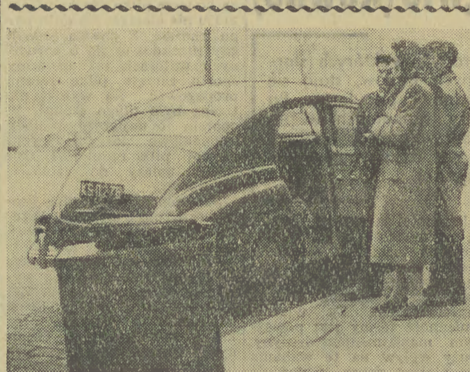
Pertrakcje z kierowcą nie daly rezultatu — niestety, szafka maszynowa do szenia nie mieści się w taksówce. Trzeba czekać aż nawinie się furgonetka.

ruszały w miasto różne czynniki upoważnione do kontroli. Czy nie należałoby powrócić do tej praktyki? Przecież każdy zdaje sobie sprawę, że co chwila jest oszukiwany, ale nikt nie ma możliwości udowodnienia tego „czarno na białym”, chociażby dlatego, że nie ma wglądu do różnych specyfikacji towarowych, znajdujących się w sklepie. Każdy więc płaci ów haracz na rzecz obsługi handlowej. Płaci i nie może zrozumieć, dlaczego władze handlowe tego nie widzą. (mk)