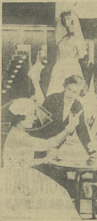
W specjalnym sklepie dla nowożeńców w Moskwie uślužne i ciepłe ekspedientki ułatwiają wybór stroju ślubnego.