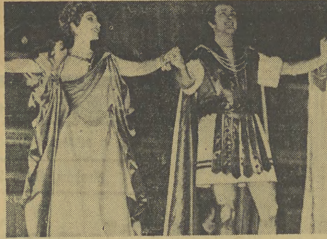
CALLAS ZNOW W LA SCALI

Wszystkich telewizorów niewłaściwie zainteresuje wiadomość, że już od 3 stycznia 1961 r. zniesiona zostanie wtorkowa przerwa. Na razie, ze względu na trudności techniczne, program wtorkowy nadawany będzie w godz. 18-22. (Dziennik telewizyjny, film oraz materiały reportażowe.)