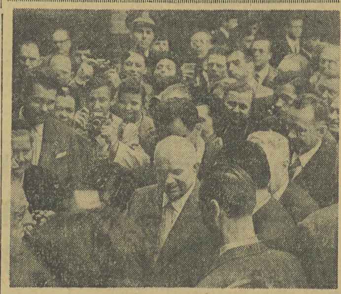
„Spotkanie z Francją” to tytuł filmu produkcji radzieckiej, który idzie w kinie „Miniaturka”...