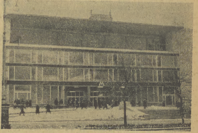
Szkoła i stal to główne materiały, którymi posługiwano się przy budowie metra.

obuwniczych, odpowiadając na apel brygad pracy komunistycznej, przystąpiły do produkcji tylko i wyłącznie artykułów najwyższego gatunku. Od tej chwili za jakość wyprodukowanych towarów odpowiada bezpośrednio przed konsumentem — fabryka. Zyskał on