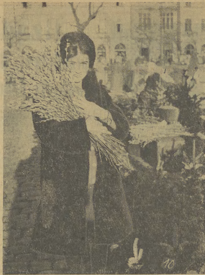
To zdjęcie nie zostało wyszukane w archiwum. Bazie wraz z ich uroczą właścicielką sfotografowaliśmy wczoraj na krakowskim rynku. Cóż to się dzieje w tym Krakowie 10 grudnia — wiosna?!

jutro Kraków będzie pod wpływem niżu. Zachmurzenie duże z przejaśnieniami. Rano mglisto. Wiatr południowo-wschodni i południowy 4-6 m na sek. Temperatura 4 st. C.