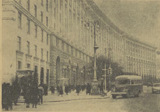
W czasie wojny w Kijowie uległo zniszczeniu 6 tys. domów. Cały prawie Kreszczatik odbudowany został w ciągu kilku lat. Oto fragment tej ulicy.

W związku z tym badacze zwracają uwagę na konieczność poddawania się w pewnym wieku periodycznym badaniom elektrokardiograficznym dla wykrywania niepostrzeżonych zawałów mięśnia sercowego.