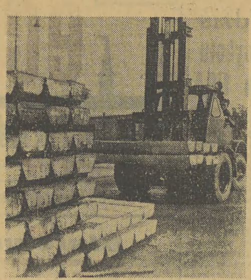
Wśród produjących — załoga Huty im. Lenina