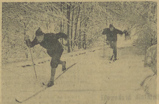
Przygotowania narciarzy nabierają coraz większego rozmachu. Na zdjęciu fragment jednego z ostatnich treningów biegaczy CRZZ pod Reglami w Zakopanem.

W pozostałych spotkaniach drugoligowych uzyskano następujące wyniki: (grupa I) Pogoń Szczecin — Stal Kutno 9:11, Warta — WKS Zawisza 6:14, Gedania — Burza Wrocław 12:8, (grupa II) Carbo Gliwice — Budowlani Poznań 16:4, Pafawag Wrocław — Astoria Bydgoszcz 6:14. Po porażce tej definitywnie rozstrzygnęły się losy pięściarzy Pafawagu, którzy opuszczają szereg II ligi.