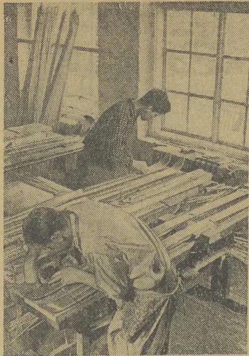
ZAKOPIAŃSKA WYTWORNI NART Zbliża się sezon narciarski, rośnie zapotrzebowanie na sprzęt. Doskonale opinią cieszą się narty produkowane przez wytwórnię zakopiańską. Zopatrzuje ona naszych wyczynowców w sprzęt, a ponadto eksportuje wysokiej jakości deski zjazdowe i skokówki. Na zdjęciu: klejenie plastikowych części nart.