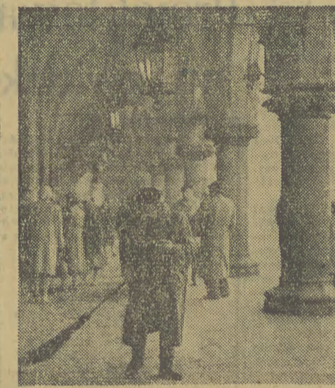
Cały dzień trzeba z młotem w ręku spacerować po Sukiennicach, aby utrzymać jak taki porządek.

chodzi bowiem o podniesienie poziomu bhp. (cz)