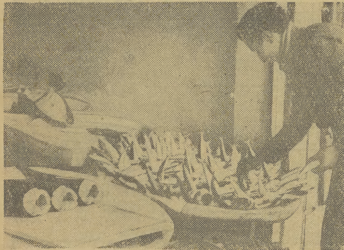
Ryby wszelkich kolorów i rozmiarów, wyłożone na ogromnych misach — to towar spóżywany niemal co krok.