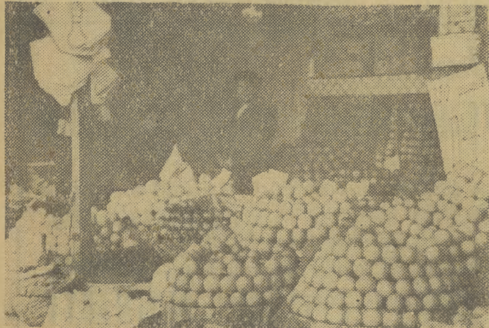
W szeroko otwartych sklepikach i kramach stopy owoców i jarzyn.