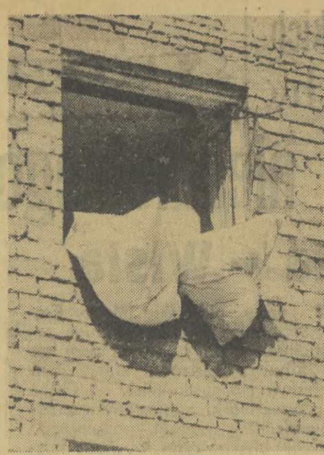
Poduszki najlepiej wietrzyć na słońcu — o tym wszyscy wiemy, ale wiemy chyba również, że nie tak właśnie należy dekorować miasto.