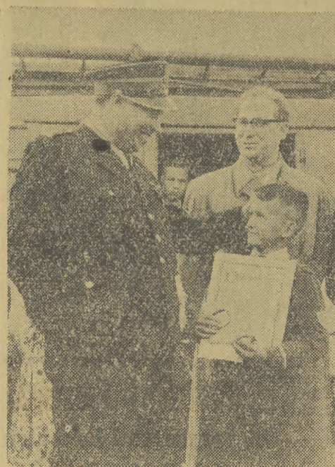
Ostatnio dzieckiem z małej wioski Waksmund w pow. nowotarskim przeżył swój wielki, obywatelski dzień — ratując 20 ha lasu przed spłonieniem.

— Jak długo zamierza Pani być w Polsce? — Chyba ze 3 tygodnie. — Jest Pani w naszym kraju po raz pierwszy? — Tak. — Czy dużo Pani podróżowała? — O tak, zwiedziłam wiele krajów. Byłam we Francji, Anglii, Portugalii, Hiszpanii, Holandii, Belgii, w Ameryce Płd., w Afryce... — Czy występowała Pani już w jakimś filmie „międzynarodowym”? — Nie. „Jons und Erdme” to mój pierwszy film tego rodzaju, gdzie wytwórcą jest Niemiec, reżyserem Amerykanin, operatorem Szwed, a ja, Włoszka, gram główną rolę kobiecą. — W jakim filmie debiutowała Pani? — W „Bez litości”. — Brz, tytuł filmu nie wróżył nic dobrego na przyszłość. — Na szczęście stało się inaczej — odpowiada śmiejąc się Giulietta Masina.