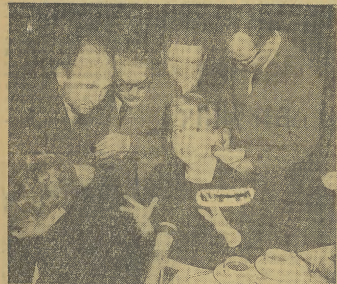
Kierownictwo „Kurt Ulrich Film” zorganizowało w Grand Hotelu w Warszawie konferencję prasową, na której zapoznano polskich dziennikarzy z produkcją filmu „Jons und Erdme”, do którego zdjęcia plenerowe będą kręcone w Polsce w miejscowości Dąbrowa Nowa (woj. warszawskie). W filmie tym w obsadzie międzynarodowej występuje również Giulietta Masina. Na zdjęciu włoska aktorka wśród polskich dziennikarzy.

RZYM Radca prawny księcia Orsini zdementował 25 bm. pogłoski na temat małżeństwa jego klienta z ex-cesarzową Iranu, Sorayą.