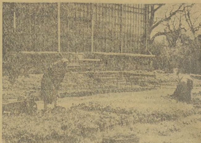
W Ogrodzie Botanicznym pracują całą parą.