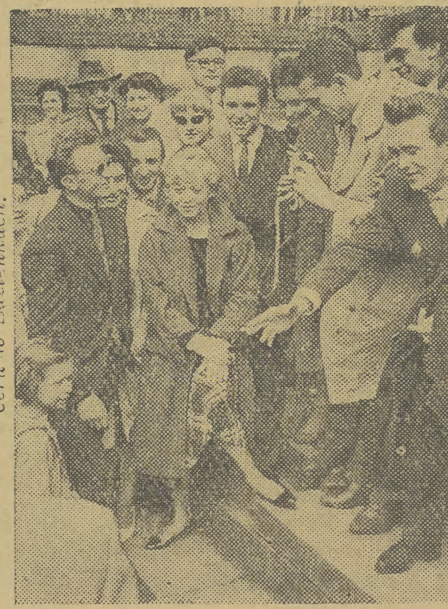
Na zdjęciu: Wybitna włoska aktorka — podczas spaceru w Łazienkach.

O czym mówiła Giulietta Masina z przedstawicielem „Echa” — czytelnicy na str. 2