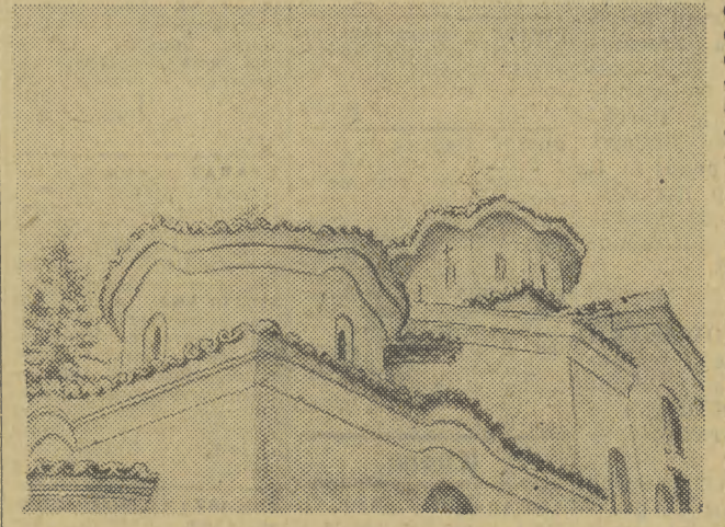
Kopuły cerkwi w klasztorze Preobrażeńskim robią wrażenie jak gdyby były obsypane koronką.

mi wzniesieniami. Powstał za czasów drugiego cesarstwa bułgarskiego kilkakrotnie płonął i był odbudowywany, aż wreszcie został zburzony przez potężny głaz, który oderwał się od ściany skalnej, wznoszącej się nad klasztorem. Na początku XIX w. klasztor został ponownie odbudowany i taki już dotrwał do naszych czasów. Dziś zamieszkały jest przez kilkunastu mnichów żyjących tu w niemal zupełnym odosobnieniu. Od czasu do czasu zawita tylko gromadka turystów i wtedy ożywia się mały cichy dziedziniec klasztorny, pstrykają aparaty fotograficzne, brodaty mnich pokazuje poczerpniałe freski w świątyni i ciemne katakumby w podziemiach. Potem turyści jadą dalej, obiecując sobie wrócić jeszcze raz do tego pełnego uroku zakątka a w Preobrażeńskim klasztorze pozostaje cisza i spokój górskiego pustkowia.