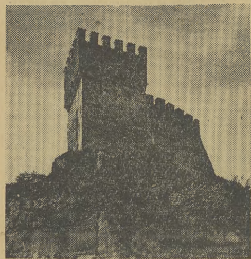
Ze starego zamku została baszta, w której więziony był wódz krzyżowców — hrabia Baldwin.