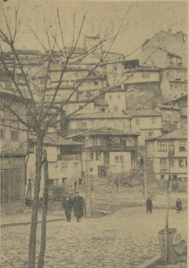
Jeden nad drugim, przyklepione do skalnego brzegu wznoszą się domy Tirnowa.

Te zakłady pozwolą z jednej strony na zatrudnienie miejscowej rezerwy roboczej, z drugiej — będą bodźcem do intensywnej produkcji rolniczej. (waś)