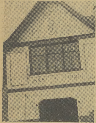
Jeden z najstarszych budynków przystani w Cambridge, wybudowany przed 130 laty.

Na uniwersytecie sportem nr 1 jest wioślarstwo. Świadcza o tym rozgrywane od roku