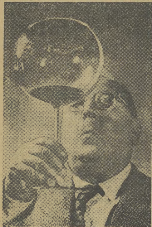
DR CUMULO- NIMBUS PRZE- WIDUJE

Cook wskazuje, że przygotowanie odpowiedzi na te propozycje poprzedzone jest ożywioną dyskusją dyplomatyczną i polityczną. Konceptja strefy bezatomowej w Europie środkowej znajduje szybko zwolenników w Londynie i w innych stołcach krajów Europy zachodniej.