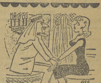
— Zawsze marzyłem, żeby spotkać w życiu tuzin kobiet takich jak Pani!