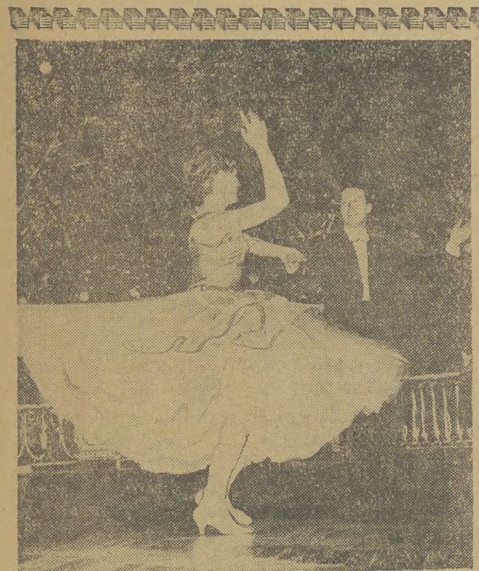
W sylwestrową noc,

P. — A więc wnosimy toast i do następnego roku