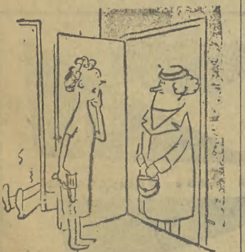
— Mamusiu, mieliśmy właśnie z Henrykiem pierwszą sprzeczkę małżeńską...

Nasza mała Ziemia narażona jest w nim na sporo nawet przez uczonych nie przewidzianych, przygód i wcale nie