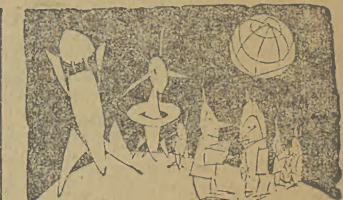
— Musimy zacząć cywilizację od początku, nikt z nas nie wzięł zapalek! („Borba”)