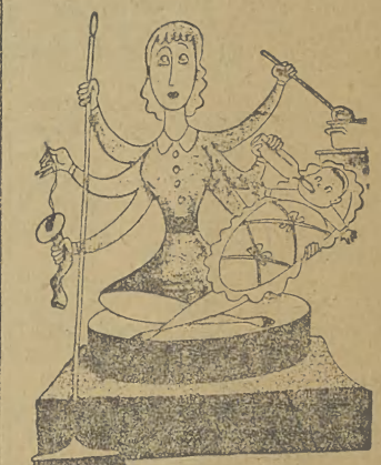
Rzeźba kobiety współczesnej w stylu hinduskim.