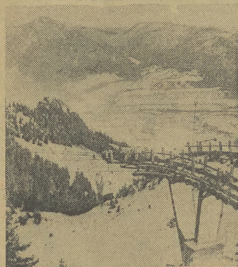
W połowie grudnia oddana została do eksploatacji najdłuższa w Alpach bawarskich Kolejka prowadzi na stację górską Brauneck (1556 m) i w ciągu godziny 63 wagoniki przewożą 400 osób.

CZY marzenia o złotych laurach chłopców, miast „opon gumowych” spełnią się, okaże się już w najbliższych miesiącach. Jedno wiem na pewno — pokażą oni grę na wysokim poziomie, od pierwszej do ostatniej tercji. J. FRANDOFERT