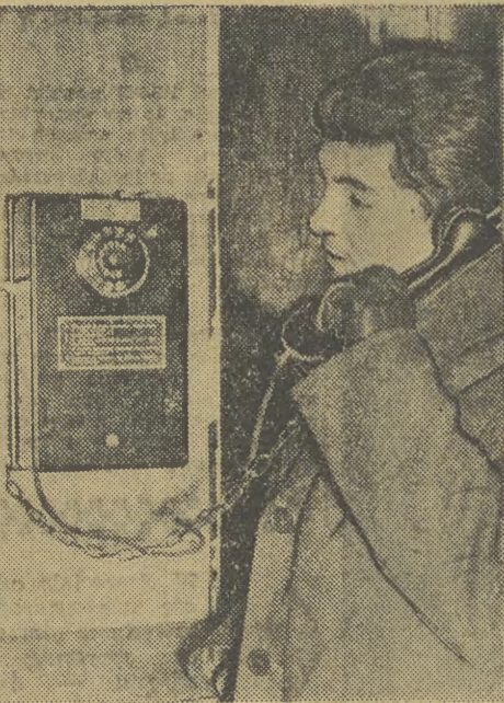
Silny, gruby łańcuch... nie zaszkodził. Niemniej niezbyt dodatnio świadczy on o uczelności krakowian. Innej rady jednak nie było!

Krakowska Drukarnia Prasowa ul. Wielopole 1. M-17