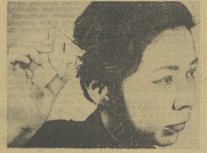
Tak wygląda plastikowa wsuwka „z muszką” — przy ładnej buzi.