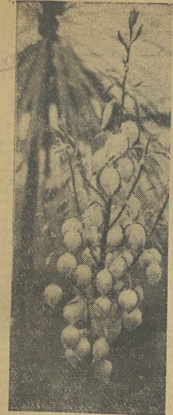
W koszalińskiej cieplarni zakwitła Yucca — roślina pochodząca z południowej Afryki. Jest to bardzo rzadki wypadek, Yucca zakwita bowiem raz na 40—50 lat. Jej kwiaty to piękne białe dzbanuski.