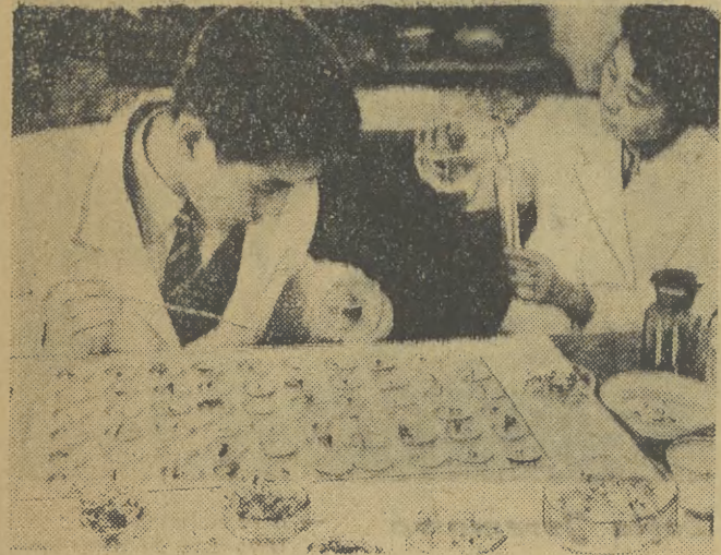
Zalążanie owadów plastikiem...

Tokijskie Przedsiębiorstwo Sztuk i Rzemiosła Inada wyrabia od niedawna bardzo oryginalną i podobno ładną biżuterię z kwiatków, owadów i małych rybek. Oprawa jest z masy plastycznej.