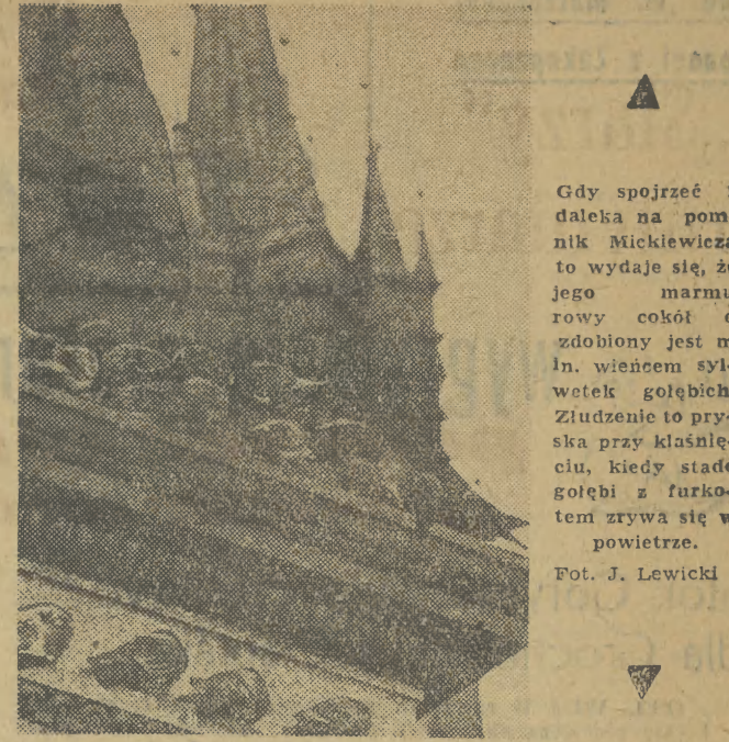
Gdy spojrzeć z daleka na pomnik Mickiewicza to wydaje się, że jego marmurowy cokół ozdobiony jest m. in. wieniec sylwetek gołębic. Złudzenie to przyska przy kłasnieniu, kiedy stado gołębi z furkotem zrywa się w powietrze.