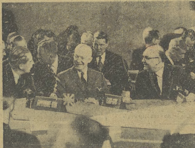
Z PARYSKIEJ SESJI NATO Na zdjęciu: Prezydent USA Eisenhower w rozmowie z sekretarzem generalnym NATO Spaakiem (z prawej) i premierem W. Brytanii Macmillanem (z lewej).

Policja zachodnio-niemiecka dostawiła obu przestępców na pokład polskiego statku „Odra“, w czasie jego postoju w porcie Kilonia.