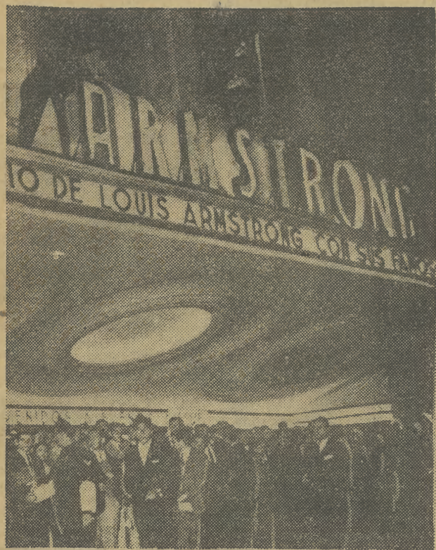
AMBASADOR JAZZU — tak mówi się często o Armstrongu. Ten muzyki artysta zyskał sympatię na obu półkuliach i należy dziś do najpopularniejszych postaci świata muzycznego.

Armstronga wszędzie wita się bardzo serdecznie, ale owa- cje jakie zgotowały mu tłumy w obecnym tournée po Ameryce Południowej przeszły wszelkie oczekiwania. Na lotnisku w Buenos Aires oczekiwała go 5-tysięczna rzesza wielbicielei, a czynili to z taką wrzawą, że wezwano na pomoc... straż pożarną, aby ugasiła (dosłownie!) zapal zebranych.