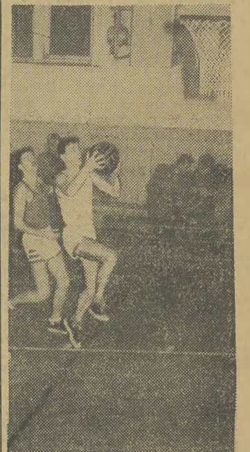
Fragment spotkania o mistrzostwo ligi międzyokręgowej — pomiędzy drużynami Startu Częstochowa i Krowodrzy. Na zdjęciu: moment pod koszem Startu Częstochowa.

W KRAKOWIE rozegrano 4 spotkania szachowe o mistrzostwo I ligi. KKS-WDK pokonał ŁKS 4:3, a AZS Kraków wygrał ze Startem Łódź 4:3. W poniedziałek KKS-WDK odniósł już 9 z kolei zwycięstwo, wygrywając ze Startem 4,5:2,5. Nie powiodło się jednak AZS, który przegrywając z ŁKS 1:6 znalazł się w sytuacji spadkowej. Po 9 kolejce rozgrywek prowadzi bez straty punktu Krakowski Klub Szachistów — 18 pkt., przed Startem Katowice. (zb)