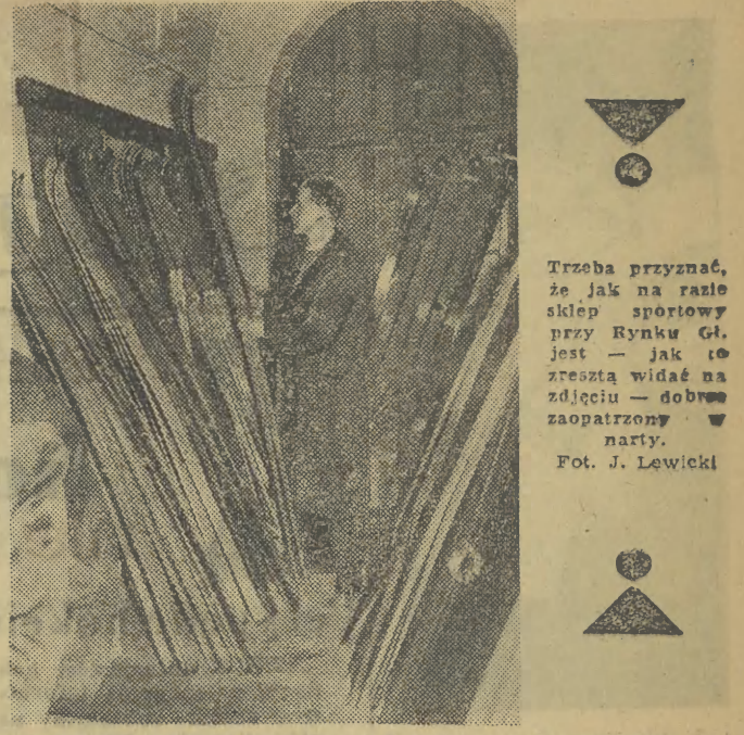
Trzeba przyznać, że jak na razie sklep sportowy przy Rynku Gł. jest — jak to zresztą widać na zdjęciu — dobrze zaopatrzony w narty.