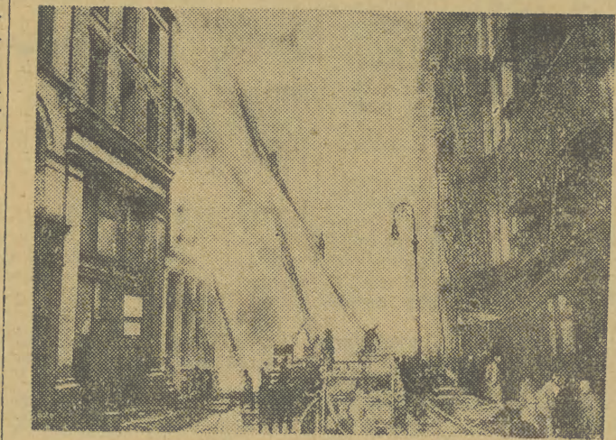
WIELKI POŻAR W NOWYM JORKU

W skład komitetu weszli m. in. wybitni działacze kulturalni NRD J. Becher, W. Bredel i A. Zweig. Komitet stawia sobie za cel wywalczenie pełnej swobody dla P. Robesona. Jak wiadomo, Departament Stanu już od przeszło 8 lat odmawia Robesonowi zezwolenia na wyjazd za granicę.