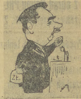
Minister T. Dietrich w karykaturze J. Zebrowskiego

Na tym zakończyło się posiedzenie Sejmu w dniu 24 bm.