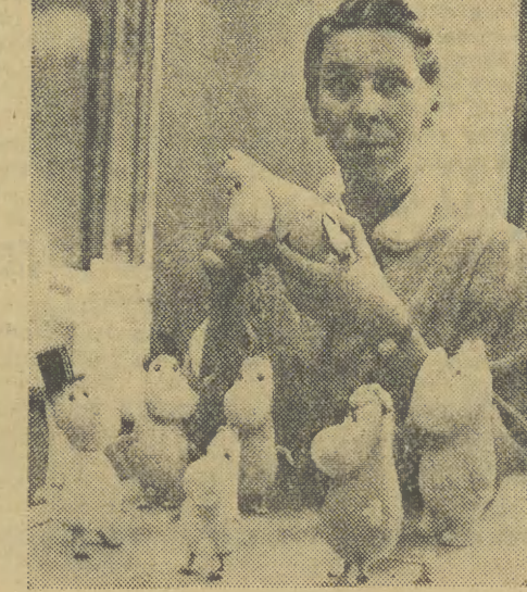
Znana fińska plastikarka Toive Jansson stworzyła nowe zabawki dla dzieci — zwierzątka o bardzo zabawnym wyglądzie tzw. „moomina”. Serię „moomina” wydano w licznych krajach europejskich, w Chinach, Australii i USA.

W przyjęciu wzięli udział: premier Eden z małżonką, minister spraw zagranicznych Lloyd, przewodniczący Izby Lordów — lord Kilmuir, prze-