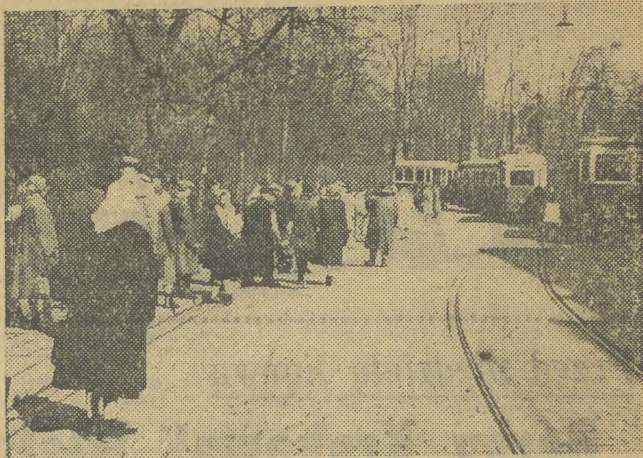
Zbyt długo trzeba nieraz czekać na „ósemkę”. A jeśli już się pojawił natychmiast zajeżdża także „dziesiątka”. No cóż, krakowskie tramwaje mają instynkt stadny.

Pod hasłem „Dzielnica Grzegórzki przoduje w czystości” trwa walka o estetyczny wygląd miasta i zdrowie obywateli.