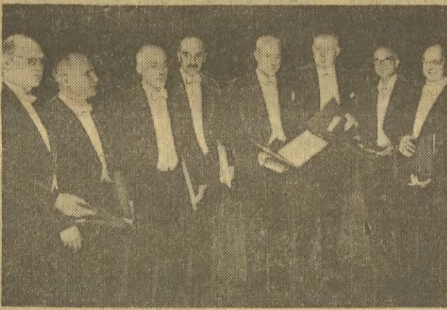
10 grudnia odbyła się w Sztokholmie uroczystość wręczenia nagród Nobla. Na zdjęciu: laureaci z dyplomami (od lewej) Amerykanie — Dickinson W. Richards i A. F. Cournand (medycyna), Brytyjczyk C. N. Hinshelwood i uczonej radziecki N. Siemionow (chemia), Amerykanin W. Brattain (fizyka), Niemiec W. Forsmann (medycyna), Amerykanie — W. Shockley i J. A. Bardeen (fizyka).