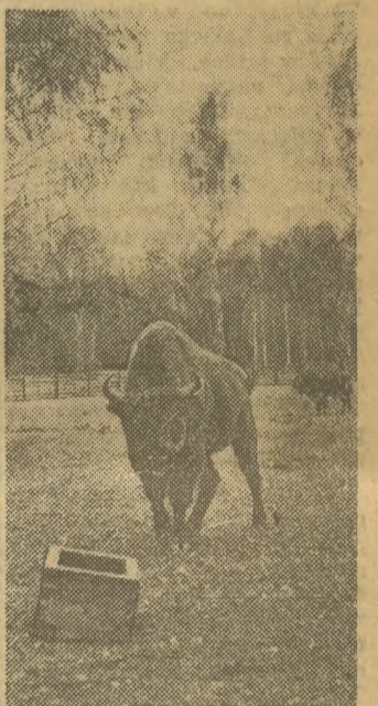
W Białowieży — królestwie zubrów.