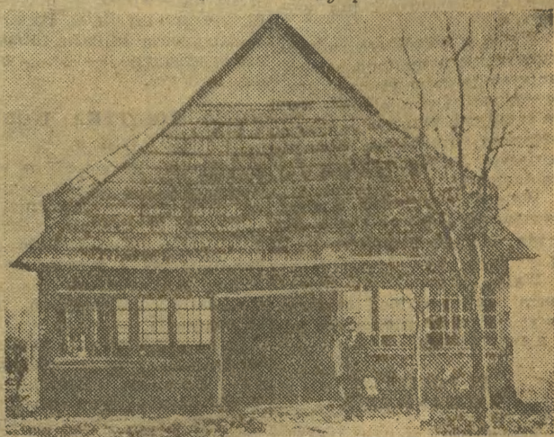
Muzeum Terenowe — widoczne na naszym zdjęciu — wybudowane zostało z funduszy społecznych staraniem Polskiego Towarzystwa Prehistorycznego nad częścią późno-rzymskiej osady garncarskiej w Igołomii-Zofjopolu w Nowej Hucie

Tak jest od 1955 r. do chwili obecnej i nikt z władz miejskich i centralnych nie pomyślał by przyjąć z konkretną pomocą dyrekcji i zalogi która z wielkim wysiłkiem przeprowadza remonty w Krakowie. (g-wz)