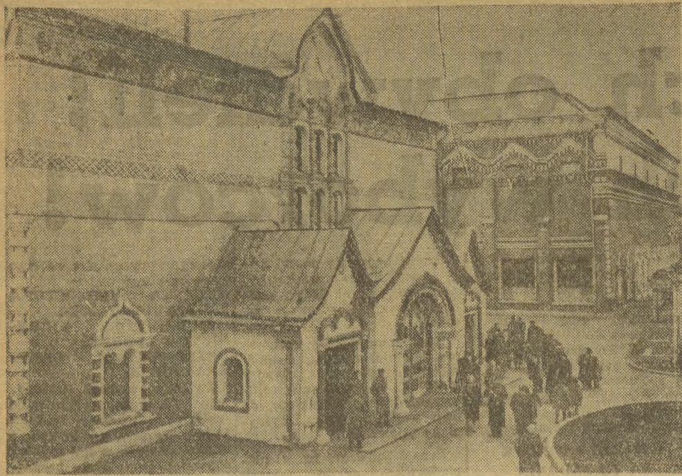
Wejście do Tretyakowskiej Galerii