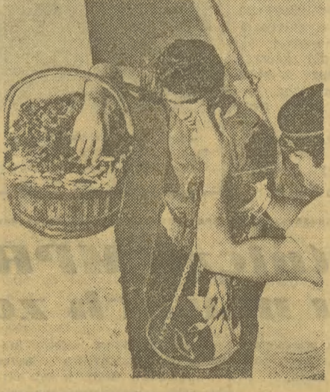
Neapol liczy około 1 miliona mieszkańców, spośród których 80 proc. trudni się handlem. Od setek już lat ciemnowłosi i ciemnocy neapolitańscy cieszą się sławą nader obrotnych handlarzy. Na zdjęciu: Dwaj sprzedawcy „owoców morza”. „Owoce morza” — to krewetki, drobne ryby itp.