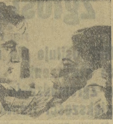
Jean Marais i Alida Valli w filmie »Cud zdarza się raz«.

NA początku po zwołaniu sobie przytoczyć w całości najkrótszą w dziejach literatury powieść: „Ukochna, czy chcesz zostać moją żoną?” — „Nie” — i byli szczęśliwi przez całe życie. Na tym konczy się ten bly świąteczny utwór napisany przez Juliana Tuwima.