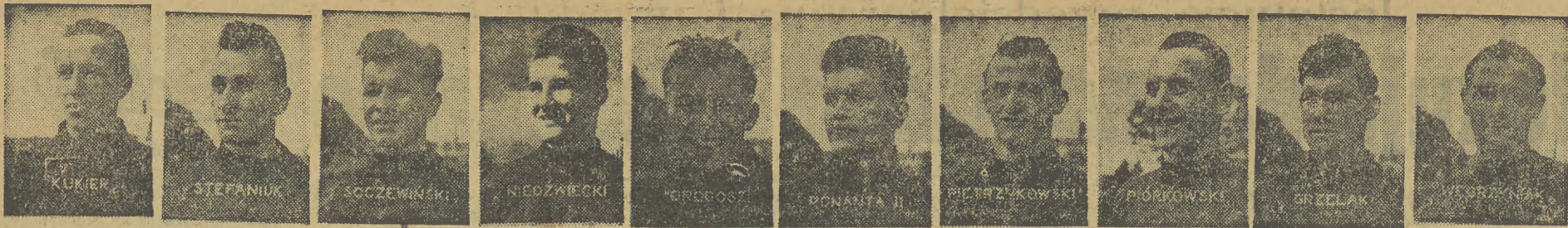
NASZ SPECJALNY WYSLANNIK RED. Z. DALL DONOSI Z BERLINA: