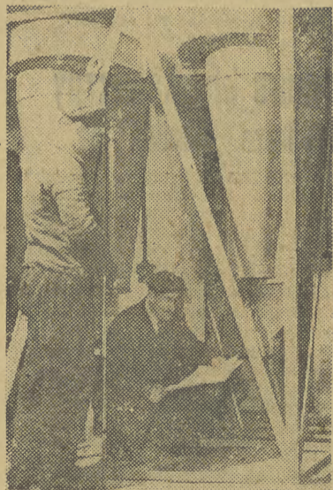
Przedsiębiorstwo Remontowo-Montażowe Przemysłu Młynarskiego „Młynomontaż” w Toruniu rozpoczęło od niedawna produkcję szeregu maszyn i urządzeń sprowadzanych dotychczas z zagranicy. Trzepaczka do worków znajdująca zastosowanie w młynach elewatorów i przemyśle spożywczym jest prototypem nowego rodzaju trzepaczki wg pomysłu Centralnego Zarządu Przemysłu Młynarskiego. Na zdjęciu: sprawdzanie detali konstrukcyjnych.

NASZE uwagi krytyczne o styli i metodach pracy Wydziału Kwaterunkowego w Krakowie, które umieściliśmy w cyklu artykułów poświęconych problemom gospodarki lokalowej w Krakowie, wywołały oddźwięk w Prezydium Miejskiej Rady Narodowej. Otrzymałyśmy pismo z Prezydium informujące nas, że odbędzie się w czerwcu br. specjalna sesja Miejskiej Rady Narodowej, poświęcona zagadnieniom pracy krakowskiego Wydziału Kwaterunkowego. Podczas sesji tej omówione zostaną sprawy, poruszone w krytycznych artykułach, publikowanych w „Echu Krakowskim”. Oczekujemy, że zapowiedziana Sesja Miejskiej Rady Narodowej przyniesie konkretne rezultaty w kierunku gruntownego zreorganizowania i zmiany na lepsze wadliwych obecnie form pracy Wydziału Kwaterunkowego. Na str. 5 zamieszczamy artykuł poświęcony problemowi lokali mieszkalnych zajmowanych przez urzędy i instytucje.