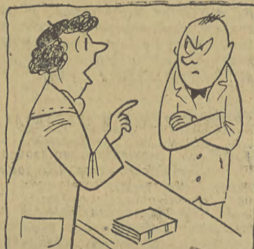
— Proszę pana, nie pamiętam tytułu tej książki, autora też nie pamiętam, ale pan na pewno wie, to taka historia o takim przystojnym brunecie, który kocha się w jednej blondynie i dla tej blondynki poświęcił wszystko, co miał!..