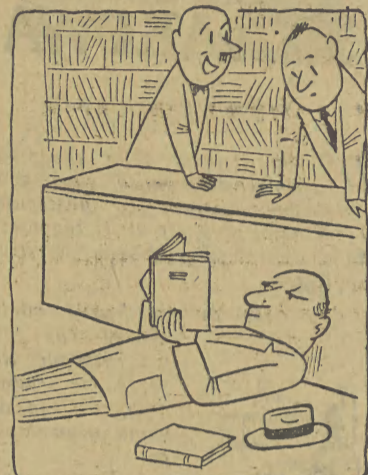
— Powiedział, że chce sobie wybrać jakąś książkę do poduszki!..

Godz. 9 i 15. Stadion ZS Sparta: Lekkoatletyczne mistrzostwa Krakowa seniorów, juniorów i młodzików.