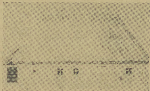
Plansza rysunkowa chaty w Pleszowie.

A JAKIE są wyniki badań? Bardzo poważne. W archiwum Sekcji złożono już 28 tys. pozycji inwentaryzowanych — wywiadów terenowych, plany rysunkowe i akwarelowych itp. Ze sprawozdań opracowywane są fotografie, artykuły i książki. Na dziesiątkach kartonów można oglądać kolorowe, jakże różniące się ornamentyką, a niekiedy i kształtem skrzynie z różnych okolic, przedmioty domowego użytku i przekroje domów. Na stolikach — ustawiono ceramikę: garnki, dzbanki i figurki. Tuż obok — drewniana, niewielkich rozmiarów skrzynia, wykonana na podstawie wzorów i pod kontrolą Sekcji przez pracowników Centrali Przemysłu Ludowego i Artystycznego — jedna z tych, które ukazują się w handlu.