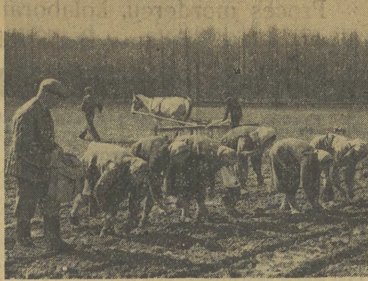
Cena 20 gr.

Montaż urządzeń powierzony został załodze „Mostostalu”, która prowadziła już poprzednio prace przy ustawianiu urządzeń walcowni-zgniatacza. „Mostostalowcy” w ciągu zaledwie kilku dni ustawili blisko tysiąc ton urządzeń w walcowni ciągłej blach.