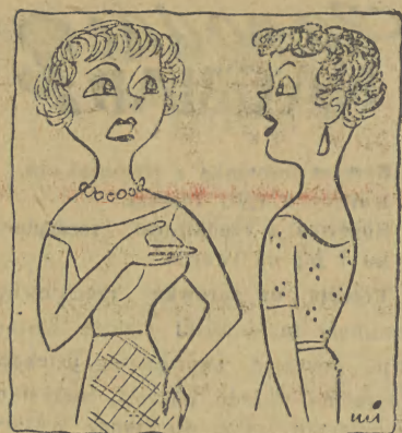
— Dlaczego płaczesz, Wandeco? Przecież sama prosiłaś, żeby ci kupił książkę!