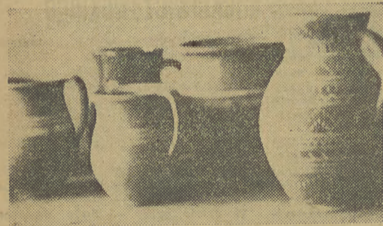
Kolekcja ceramiki sieradzkiej.

Niedawno przeprowadzono w Piętnicach badania nad architekturą dla wojewódzkiego konserwatora zabytków przyrody, a dla Instytutu Wzornictwa Przemysłowego dokonano prace nad ośrodkiem garncarskim w Maniowicach w pow. nowotarskim. Na podstawie badań opracowano stroje ludowe dla Zespołu Pieśni i Tańca Związku Zawodowego Budowlanych w Częstochowie i dla Zespołu Pieśni i Tańca w Suwałkach. Sekcja dostarcza też materiałów poszczególnym Muzeom Etnograficznym i przeprowadza dokumentację wystaw sztuki ludowej.