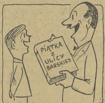
— To za to, że miałeś same piątki na ostatniej wywiadówce!