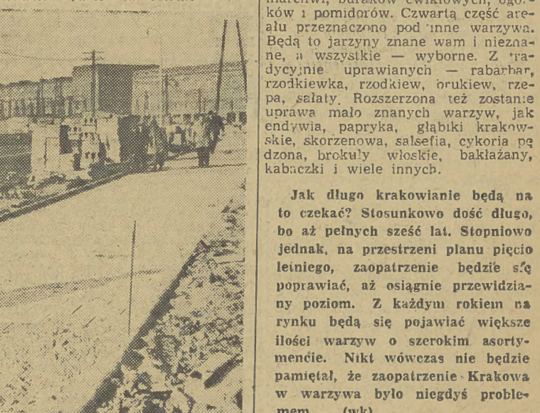
Prace przy budowie ulic i jezdni w niektórych osiedlach Nowej Huty.

Prace przy budowie ulic i jezdni w niektórych osiedlach Nowej Huty. Na zdjęciu widzimy budowę nawierzchni ulicy, która prowadzić będzie na osiedle B-1.