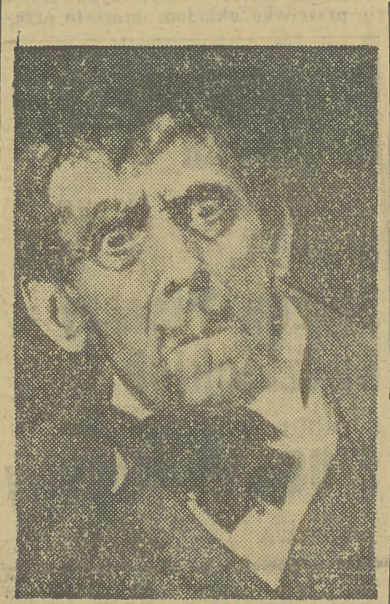
Latka w „Dożywociu” Fredry, to jedna z najznakomitszych ról wielkiego aktora w komediach fredrowskich, a stworzył ich całą galerię.