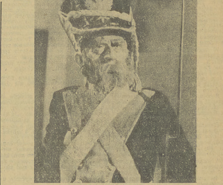
LUDWIK SOLSKI Jako Wiarus w „Warszawiance” St. Wyspiańskiego.

Ponad 1100 ról, 10 tysięcy przedstawień — to niespotykane w dziejach teatru liczby obrazujące ogrom pracy aktorskiej Ludwika Solkiego. Oto kilka z najwybitniejszych kreacji wielkiego artysty.