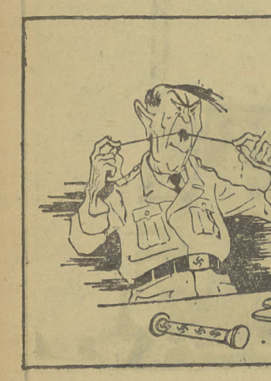
Według starego wzoru (Neues Deutschland)