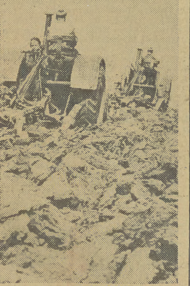
Zalogi PGR woj. olsztyńskiego, wykorzystujące dogodną warunki atmosferyczne, nadrabiają zaległości w orkach przedzimowych.

Prezydium Miejskiej Rady Narodowej prosi obywateli o wzięcie jak najliczniejszego udziału w tych sesjach.