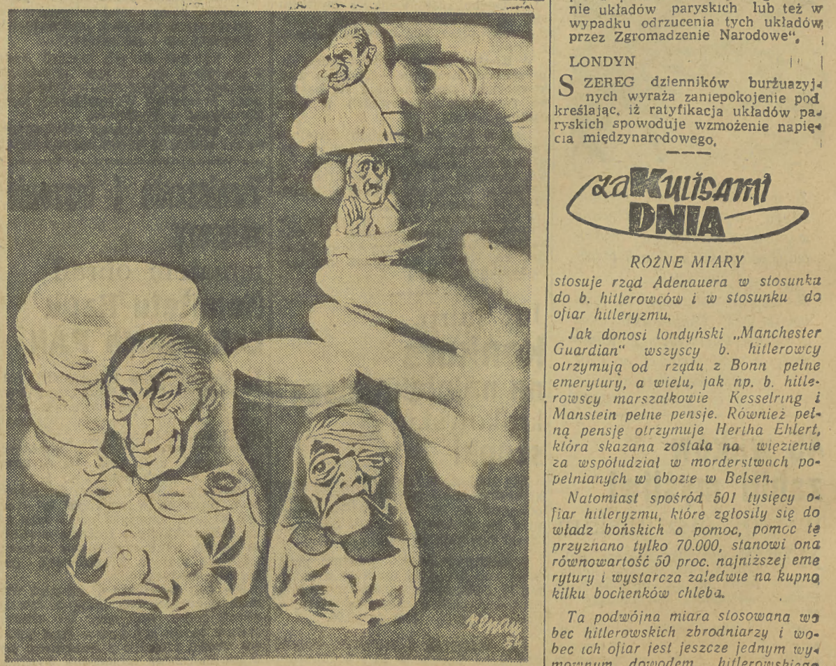
OD ADENAUERA... DO HITLERA. „Eulen Spiegel”