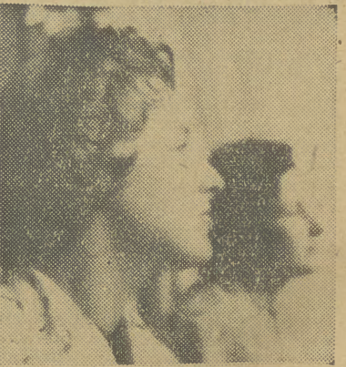
Ta fryzura jest modna i praktyczna, należy ją lansować w społecznych punktach usługowych w okresie karnawału — postanowiła komisja.