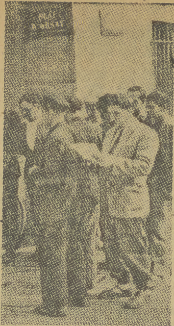
Na zdjęciu: jedna z licznych delegacji, domagających się w imieniu ludności odrzucenia układu paryskiego, na Quai d'Orsay (ulica przy której mieścił się francuski min. spraw zagranicznych).