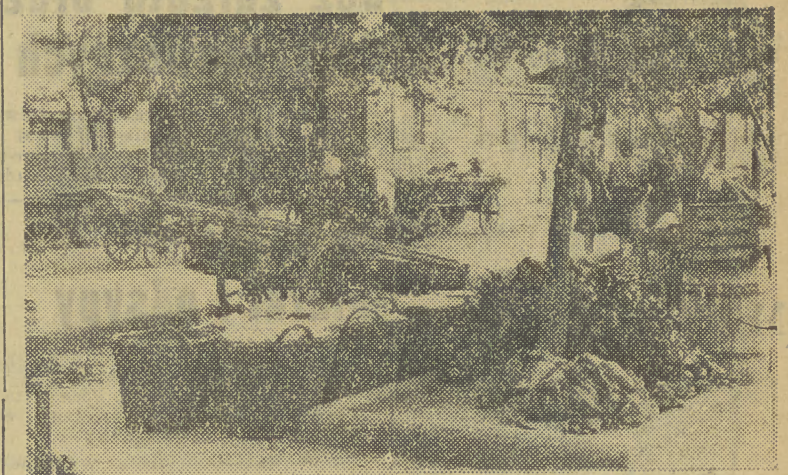
Na placu Kleparskim już od 5 rano ruch! To pracownicy handlu uspołecznionego przygotowują świeże jarzyny i owoce dla swoich stoisk.