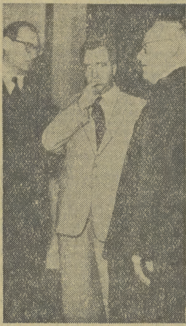
Szef delegacji polskiej na VIII sesję Zgromadzenia Ogólnego Narodów Zjednoczonych — wiceminister Spraw Zagranicznych M. Nuszowski w rozmowie z szefem delegacji radzieckiej wiceministrem Spraw Zagranicznych ZSRR A. Wyszyńskim. Obok stoi minister pełnomocny J. Suchy