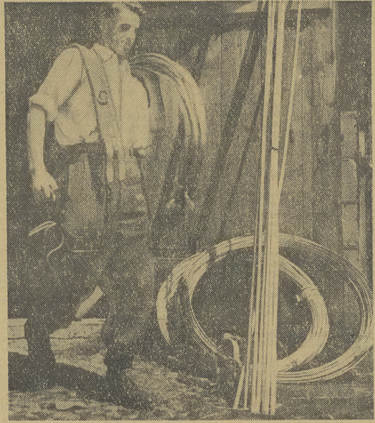
Chłopi, tak starzy jak i młodzi chętnie pomagają w pracy przybyłym elektrykom, a idzie ona rażno, gdy się ją pokonuje zbiorowym wysiłkiem, który krzepi myśl, że już nie długo zabłyśnie we wsi światło. Chłopi kopią więc doły, wbijają słupy, oczywiście pod okiem fachowców z ekipy, ci ostatni mają pełne ręce roboty instalując na słupach przewody.

Och „Kino!”, niezapomniany belfrze! Gdyby ci się nie pomarło któregoś smutnego dnia, gdybyś dożył w zdrowiu chwili dzisiejszej — rzuciłbyś pewnie w diabła tamtą niko-mu nie potrzebną szaloną maszynę i uruchomił swa całkiem w gruncie rzeczy nie głupią głowę dla spraw przydatnych wszystkim.