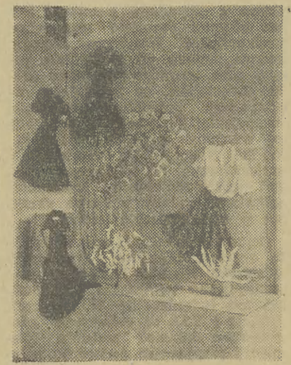
Stoisko Państw. Liceum Przem. Odzież. w Skalce koło Olkusa

uczniów oraz wciągania ich do pracy twórczej.