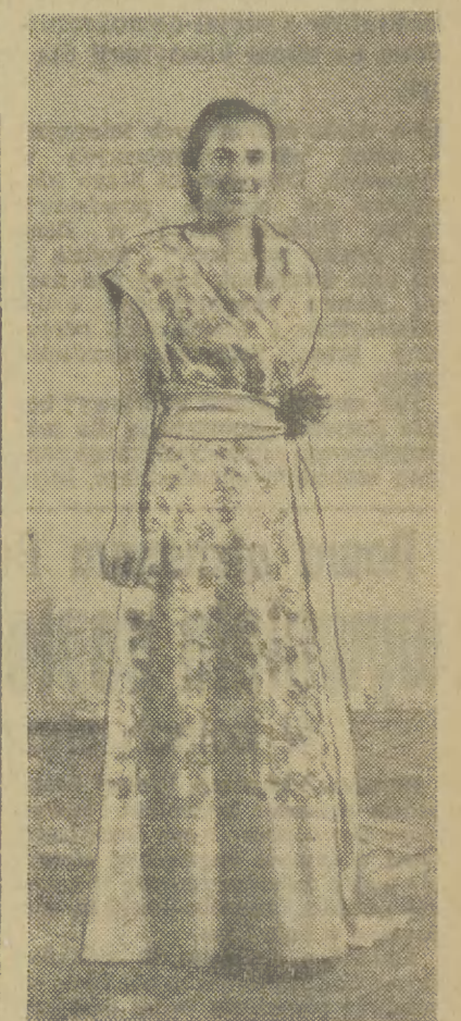
Z dwóch starych sukien — jedna elektowna „podomka”

impresy był fakt, że nie dało się udostępnić jej szerszemu ogółowi — raz, że brak środków nie pozwolił