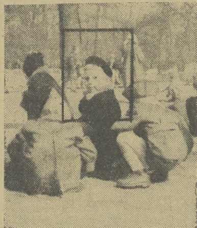
Rodzice dziecka, które fotografi „Echa” ujęli na tym zdjęciu w ramce, otrzymają 1.000 zł, po których odbiorze zechcą zgłosić się do redakcji.

nie do załatwienia wcielenie zachodnio-niemieckiego arsenału wojennego do umii zachodniej i paktu atlantyckiego.