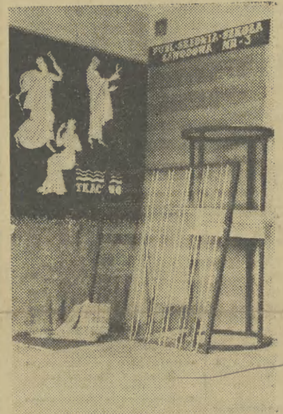
Stoisko 3 Publicznej Średniej Szkoły Zawodowej w Krakowie (Grodzka 54)

Tegoroczną Okręgową Konferencję Ośrodków Dydaktyczno-Naukowych dla Szkół Zawodowych okręgu krakowskiego i rzeszowskiego została zorganizowana z dużym rozmachem, przynosząc nauczycielstwu wiele no-