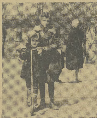
A to czyja jest dziewczynka? Rodzice jej, którzy udowodnią nam iż owa właścicielka hulajnoży jest ich dzieckiem, otrzymają nagrodę za pilne czytanie „Echa” 1000 zł.

Czyja mamusia dostanie od „Echa” 1000 złotych