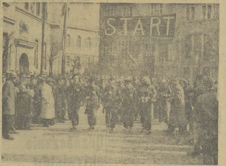
25 MARCA br. nastąpił w Rzeszowie start do I etapu marszów patrolowych — „Ostatnim szlakiem Bohatera - Rewolucjonisty gen. Karola Świerczewskiego”. Na starcie patrol „Kolejarza” (patrol Centralny). CAF — fot. Szyperko