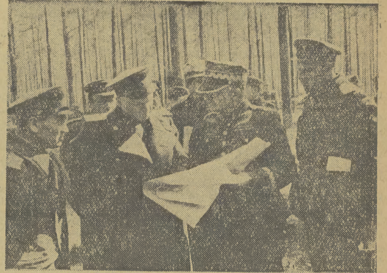
W przededniu sforsonowania Nysy przez II Armię WP (16 kwietnia 1945 r.) Gen. Karol Swierczewski omawia plan operacji z przedstawicielami oddziałów radzieckich

Postać Karola Swierczewskiego jest dla narodu polskiego wzorem patriotyzmu i internacjonalizmu