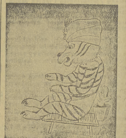
TYGRYS — FAKIR ALI — BENGALI