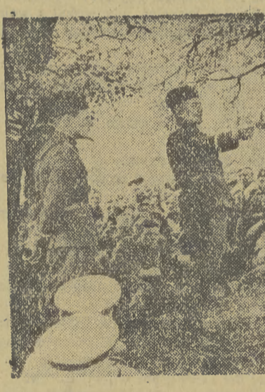
Gen. Swierczewski w rozmowie z oficerami I Armii WP.

Jeszcze dziś towarzysze generała, którzy pod Jego dowództwem zwyciężali pod Madrytem i Saragossą, snują wspomnienia o „El Generale Polacco”, o meżnym Walterze, który w czasie zaciętych walk z faszystami