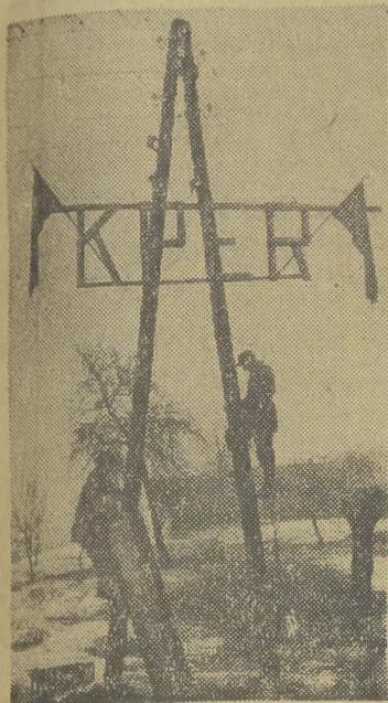
1) Uroczystość całkowitego zelektryfikowania słynnej wsi Zaliptu nie może się obejść bez pięknej elektrycznej iluminacji. Ostatnią więc czynnością monterów było założenie dekoracji i świetlnych napisów na słupach nowej linii...