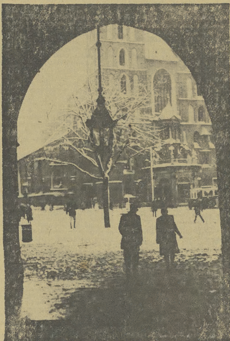
A jednak zima nie ominęła Krakowa. Zagładnęła również i na Rynek krakowski, przyprószyła śniegiem dachy i gałęzie drzew...