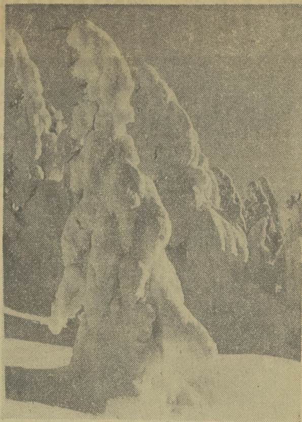
Z DJĘCIE zatytułowane „Drzewa w okiści“, jest jedną z najpiękniejszych prac Włodzimierza Puchalskiego