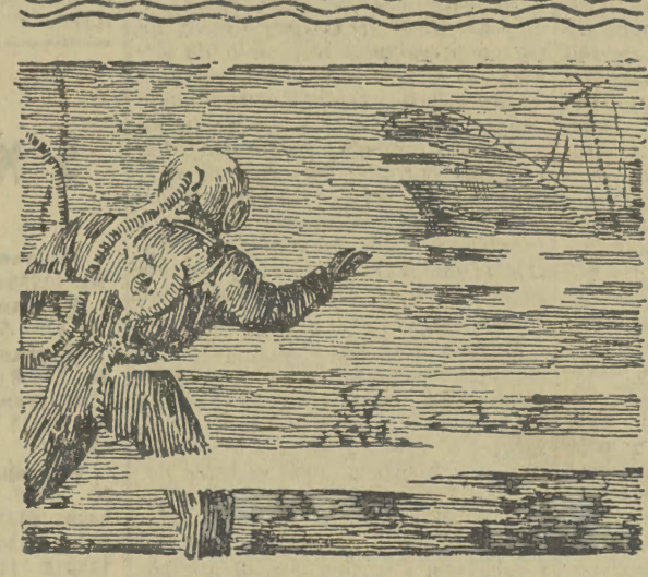
Rys. M. Walentynowicz

rekompresyjnej. Wiał rozwiwał mu czarne, kędzierzawe, dawno nie przystrzyżane włosy, okalające potężną tyśną czaszkę.