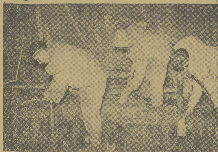
Z głębokich studni szybu przez całą dobę dochodzi jazgot pneumatycznych młotów i grotów, którymi górnicy wyrębiają przysłą trasę metro.

PO filmach okupacyjnych nastąpił zwrot do tematyki współczesnej. Ale z chwytnością na gorącym uczynku naszego wciąż zmieniającego się, tak różnorodnego i tak bogatego życia, było jeszcze trudniej. Filmy współczesne, jakie wyprodukowaliśmy, obracają się w kręgu różnych zagadnień. Przelamaniu starych nawyków burżuazyjnych poświęcone są „Dwie brygady”, oświadczenie pracy wojska pogranicza „Czar-