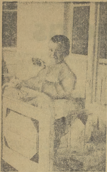
Mały Wojtuś czuje się dobrze — świadczy o tym jego uśmiech nięta buzia.

Jankowski — Warszawa. List wysłany pocztą. (1230)