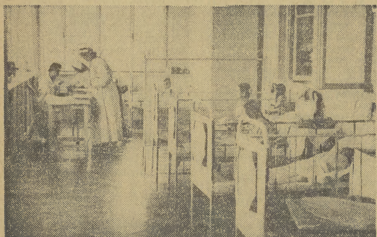
OTO jedna z sal Kliniki Chorób Dziecięcych Akademii Medycznej w Krakowie. Pod troskliwą opieką lekarzy oraz personelu pomocniczego dzieci przychodzą szybko do zdrowia.