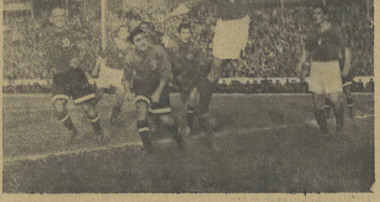
Gorący moment pod bramką »Unii« na meczu s »Dynamo« na stadionie wrocławskim.

W Koszycach odbył się bieg maratoński o mistrzostwo CSR z udziałem 75 biegaczy. Zwyciężył Sztupp (Sokol Zielonicy) w czasie 2:41:07,8 godz przed Biala (Brno).