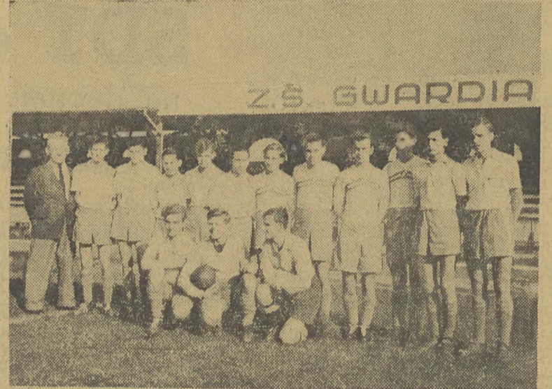
PIŁKARSKA drużyna juniorów Krakowskiej Gwardii, która w ub. uzyskała wiele pięknych wyników, zdobywając nieoficjalny tytuł mistrza Krakowa.

Ogółem startowało 27 zawodników. Najlepszy w jeździe zręczności okazał się Jabłoński pkt. 0, czas 2,14 min., 2) Fijałkowski K. pkt. 1, 1, 57 min. Trzecie miejsce zajęli równocześnie dwaj zawodnicy Lige i Grzyn pkt. 1, czas 2,22 min. Poza konkursem najlepszy czas uzyskał inż. Cwiżewicz Wl. 2,13 min. 0 pkt. karnych. W „pogoni za lisem” zwyciężył Zywiół Wldzów ok. 1000 osób. (ww)