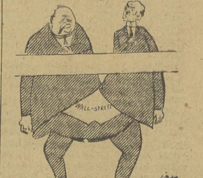
W W. Brytanii w zbliżających się wyborach kandyduje z ramienia Labour Party — Attlee, z ramienia partii konserwatyistów — Churchill.