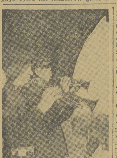
Hejnał z wieży ratuszowej.

Na tym polu miasto ma istotnie bardzo wiele do zrobienia. Klasa robotnicza odczuwa katastrofalny brak mieszkań. Tylko w I półroczu do władz kwaterunkowych wpłynęło 13 tysięcy wniosków o przydział lokali, a w olnych mieszkań brak. Robotnicy duszą się w fatalnych komórkach... Setki domów trzeba zburzyć jeszcze w tym roku, gdyż życiu ich lokatorów grozi wielkie niebezpieczeństwo.