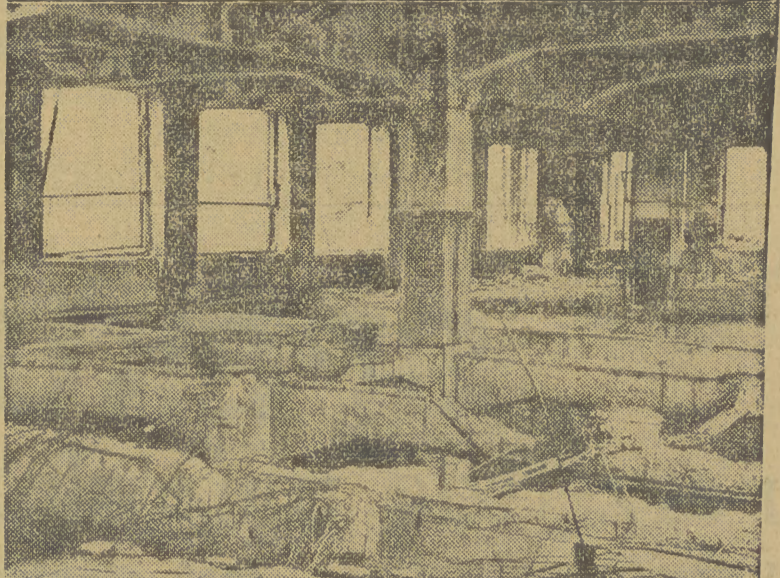
Tak wyglądała fabryka po ucieczce Niemców.

W jesienne wieczory w Klubie, przyzwyczajają się już do niego, czują się tu jak u siebie w domu i są z niego dumne.