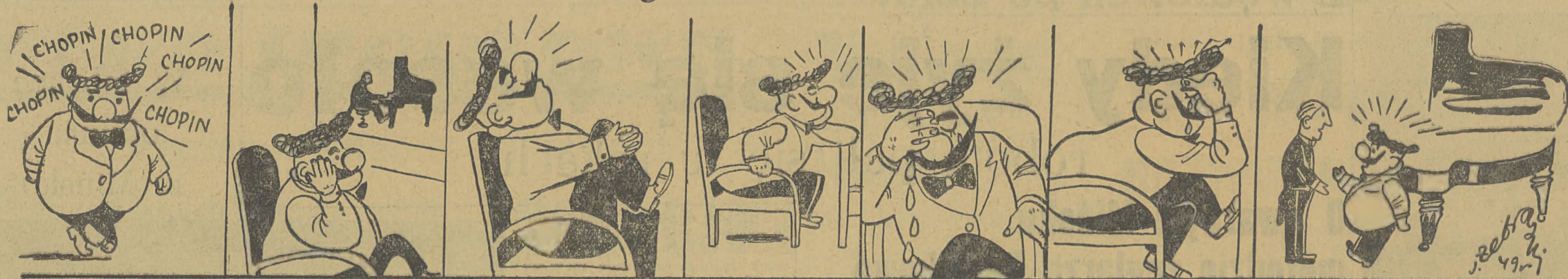
— „Chodzi za mną” — Ach! jak pięknie. — Smutna, sentymentalna muzyka. — O człowiek marzy i marzy. — I płacze. Dusza płacze. — Wzruszył mnie do głębi. — No i jak panu się podobał Czajkowski w moim wykonaniu?