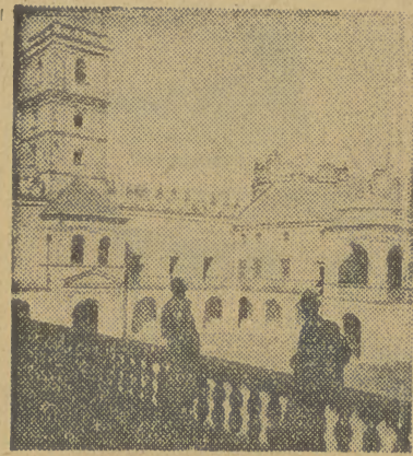
WYREMONTOWANY piękny stary zamek w Krasińcu koło Przemysła. Będzie tu zorganizowany ośrodek czasów dla członków Związków Zawodowych Literatów i Plastyków.