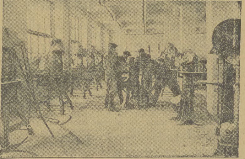
A tak wygląda po odbudowie.