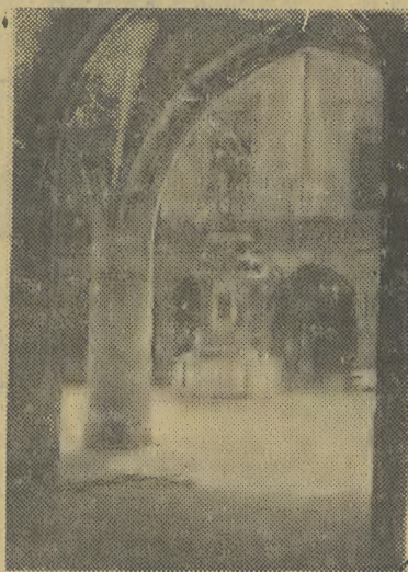
Piękne arkady na dziedzińcu Biblioteki Jagiellońskiej z widocznym w głębi pomnikiem Mikołaja Kopernika

Wspaniała zabytkowa architektura starego Krakowa