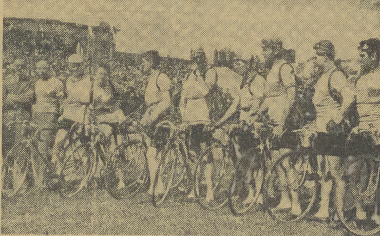
Etap Olsztyn — Gdańsk był przede wszystkim sukcesem kolarzy - robotników angielskich, którzy wygrali go w klasyfikacji drużynowej, demonstrując doskonale zrozumiane pojęcie jazdy zespołowej. Przy Angliku, który miał defekt, zostało zawsze trzech innych kolarzów, którzy pomagali mu następnie dogonić czołówkę.