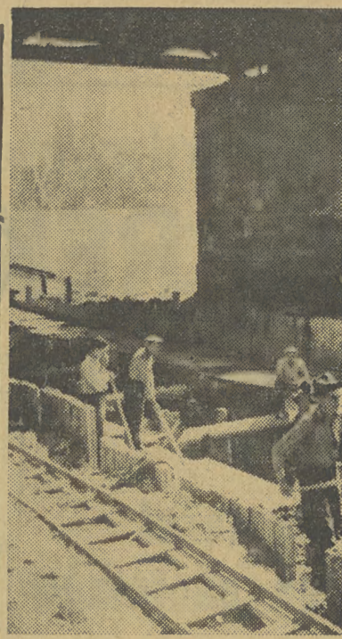
JEDNO z przęseł mostu Dębnickiego wymaga wzmocnienia. Naprawa jest właśnie w toku i most niedługo będzie jak nowy.

Rok IV. Kraków, Niedziela 21 sierpnia 1949 r.