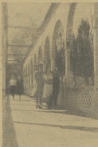
40 lat temu w miejscowości Kojarsa nad jeziorem Isyk-Kul ludzie żyli w warunkach niemal pierwotnych. Dzisiaj jest tam piękne uzdrowisko, w którym leczą się obywatele radzieccy.