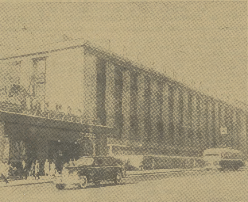
Metro moskiewskie i biblioteka im. Lenina oraz tysiące, tysiące innych wspaniałych i wielkich rzeczy — to wszystko osiągnięcia WKP (b)

W dniu 10 marca wszystkie gazety poświęcają swe szpalty 10 rocznicy 18 Zjazdu WKP (b).