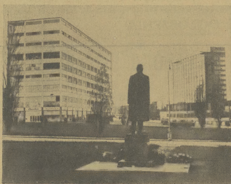
Widok miejscowości Gotwaldów (Zlin) w Czechosłowacji