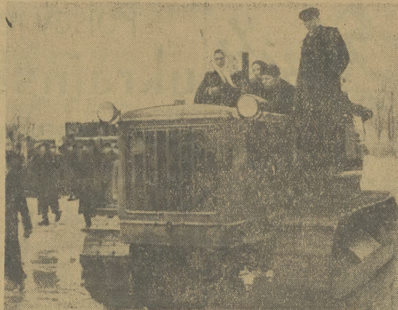
Delegacja chłopów polskich w czasie zwiedzania orzechowskiej (Ukraina) Stacji Maszynowo Traktorowej oglądała forty sprzet techniczny, którym rozporządza ta SMT. Na zdjęciu pracownicy SMT i członkowie delegacji chłopów polskich jada na traktorze.

Ze względu na tok śledztwa nazwiska aresztowanych nie zostały ujawnione.