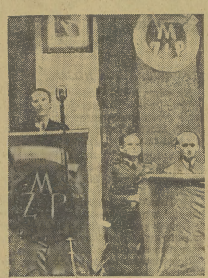
Wiek zjednoczonej młodzieży w sali Domu Żołnierza

Nie było również przypadkowym zbiegiem okoliczności, że Kongres Młodzieży Polskiej gościł liczne delegacje młodzieży z zagranicy z przedstawicielami SFMD na czele, gdyż młodzież polska jest przekonana, że zorganizowanie młodzieży całego świata w szeregach SFMD dopomoże do osiągnięcia trwałego pokoju.