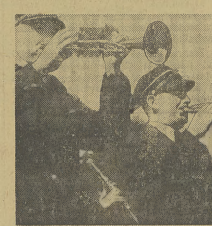
Fanfara orkiestry kolejarzy w momencie przekazywania parowozu

Kolejarze warsztatów i parowozowni głównej PKP Kraków-Płaszów