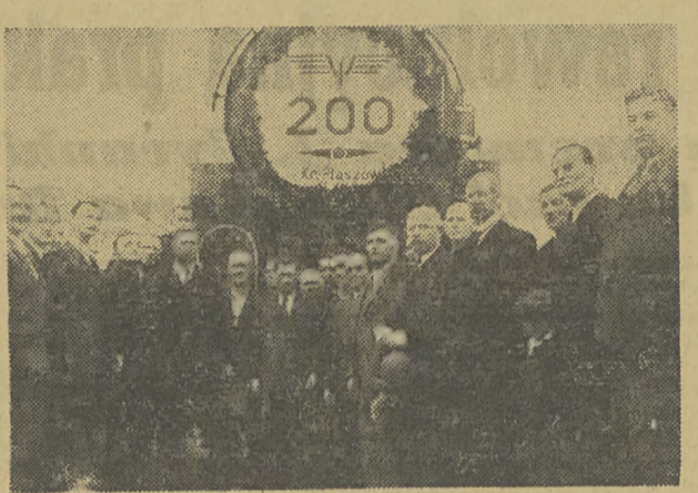
Przodownicy pracy warsztatów płaszowskich