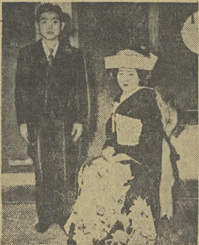
Młoda para japońska: panna młoda w tradycyjnym stroju

RÓŻNE są obyczaje weselne w rozmaitych krajach... Nie ma jednak chyba bardziej oryginalnych uroczystości ślubnych od zwyczajów panujących w Japonii. Zwyczaże te nie są tylko obyczajami tzw. „ludowymi” tj. uprawianymi jedynie przez ludność wiejską. Przeciwnie, zwyczaże te, li-