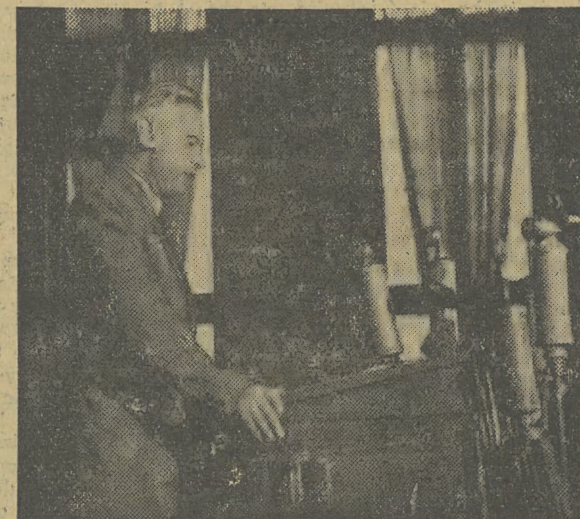
Przemówienie delegata rosyjskiego, Fadijewa