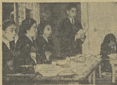
„San-San-Kudo”, czyli właściwa ceremonia. Kapłan odmawia modlitwę

co znaczy: bardzo zażądawo: „trzy-trzy-dziewięć razy z wszystkiego”... Ceremonia odbywa się przy współudziale buddyjskiego kapłana oraz jego małżonki. Młoda para zasiada