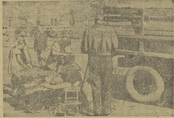
Przyjemnie jest po powrocie z wczasów „wylądować” w samym sercu miasta

U PODNÓŻA GÓR wśród pól, łąk i lasów, czy też wreszcie na wybrzeżu morskim. Wracają opaleni, wypoczęci, z za-