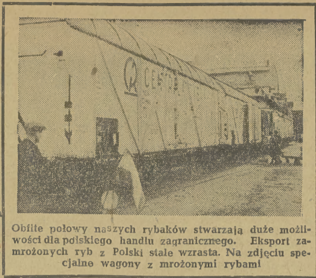
Obfite połowy naszych rybaków stwarzają duże możliwości dla polskiego handlu zagranicznego. Eksport zamrożonych ryb z Polski stale wzrasta. Na zdjęciu specjalne wagony z mrożonymi rybami