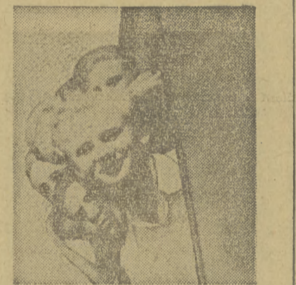
„Patrzcie chłopcy, może ktoś z domu czeka na peronie”

pašem nowych sił i z wesołą piosenką na ustach. Wracają, by stanąć przy warsztatach, zasiąść przy biurkach czy w ławach szkolnych do pracy i