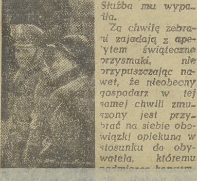
brala się cała rodzina. Przyszli też i sąsiedzi.