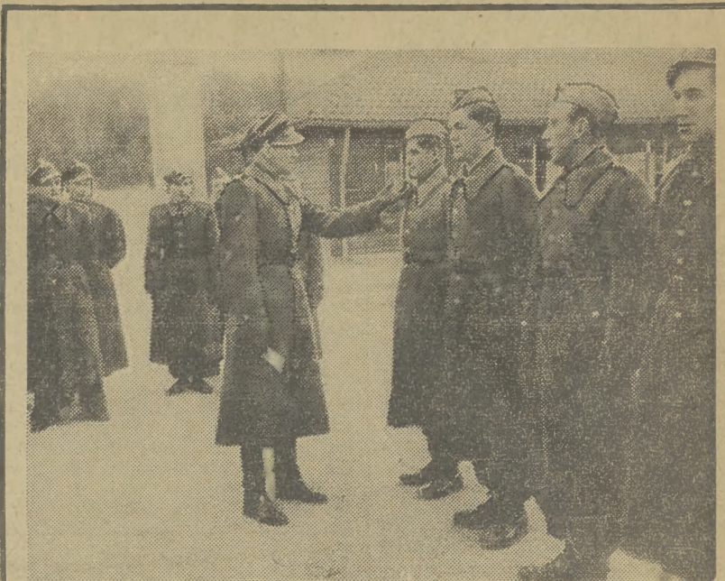
Kurs dowódców kompanii Służby Polsce w Złocińcu. — Patrz artykuł na stronie 2.

JEROZOLIMA. Podczas Świąt Wielkanocnych doszło do nowych ataków arabskich przeciwko Żydom. Podczas jednego z tych ataków zginęło kilkunastu Żydów, a kilkudziesięciu zostało rannych. Walka rozegrała się w odległości zaledwie półtora kilometra od Betleem. Po raz pierwszy interweniowało kilka samolotów żydowskich. W drugim starciu arabsko-żydowskim zabitych zostało 42 Żydów.